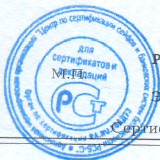
Схема сертификации - 1